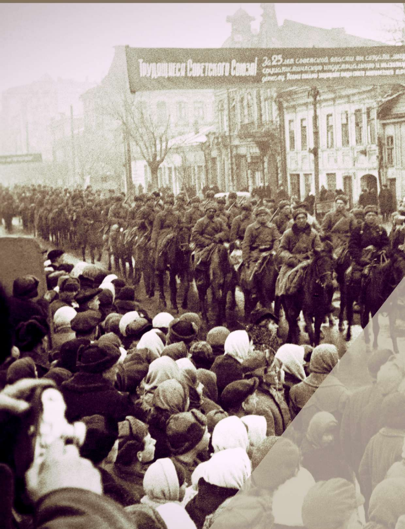
г. Ростов-на-Дону, пр. Буденновский, 23