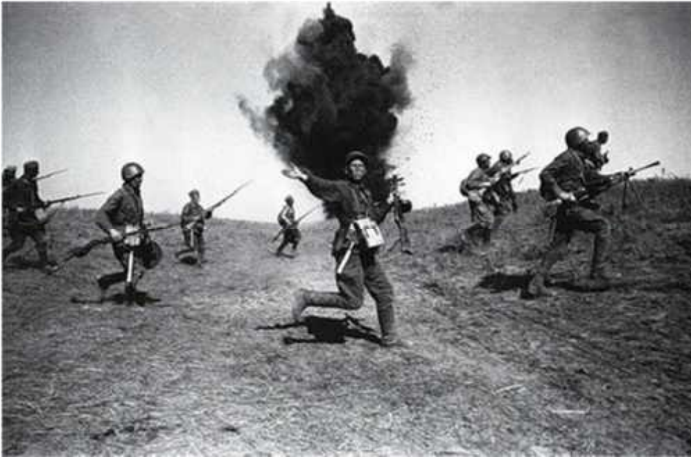
«Мужчины ушли на фронт».