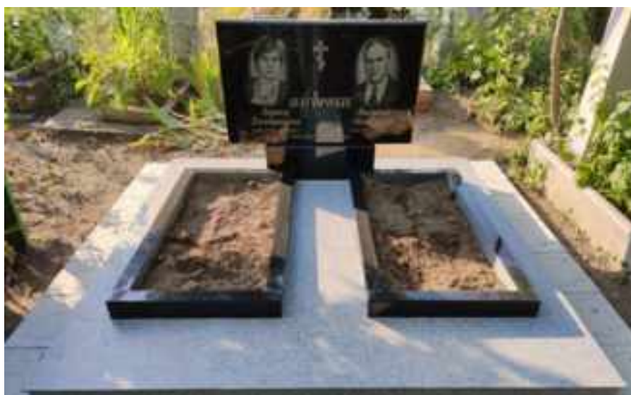
«Прабабушку вместе с прадедушкой похоронили на его родине, в Молдавии».