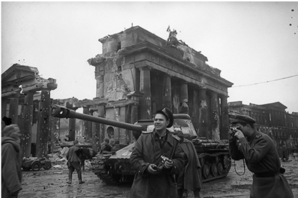
«День Победы. 9 мая 1945 года»