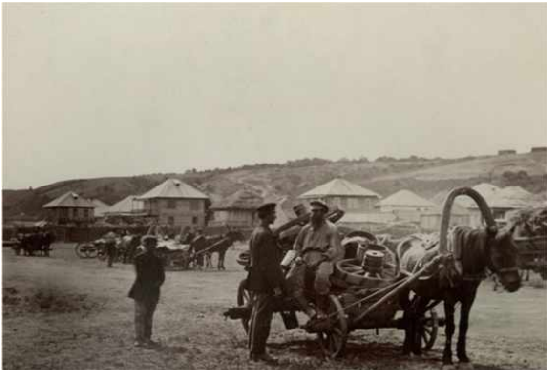
«Страшный голод 1932-1933 годов»