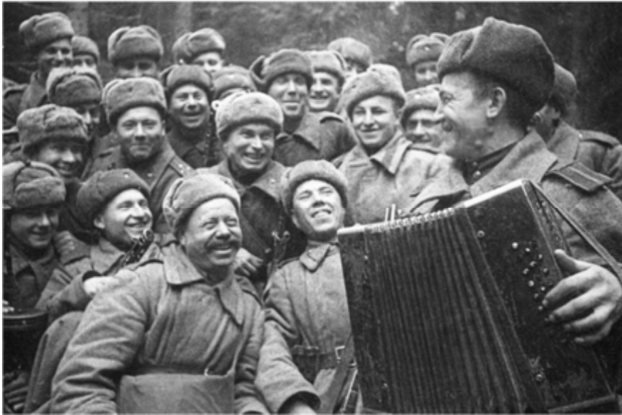
«С трофейным баяном прошёл всю войну».