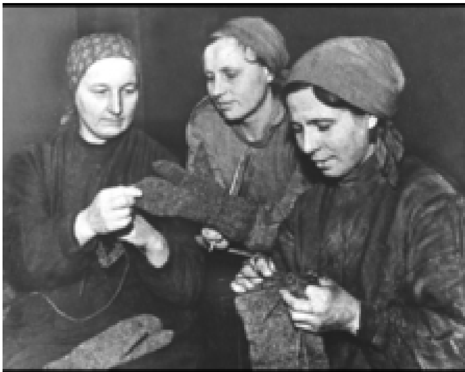
«Дома остались только женщины, старики и дети. Они вязали для фронтовиков носки, варежки, шили кисеты».