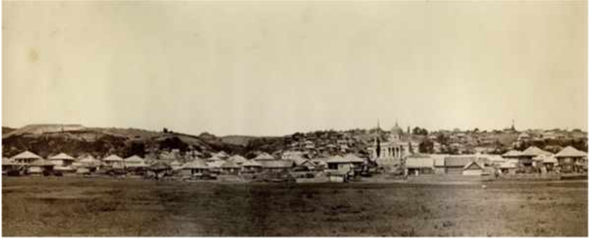
«Станица Егорлыкская Азово-Черноморского края. 1939 год»