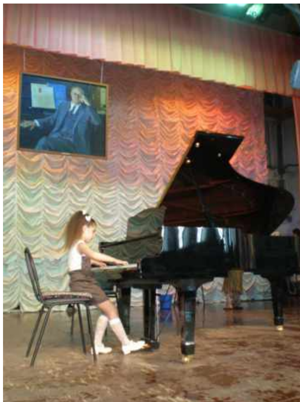
«Я яблочко от их яблоньки».